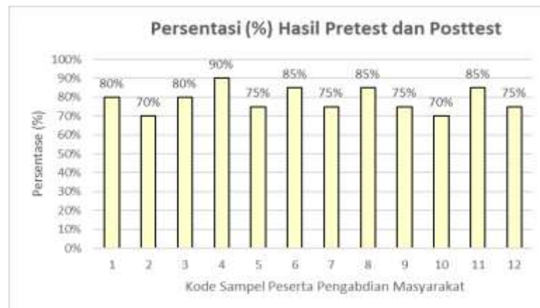
Gambar 2. Persentase pretest dan post test Peserta Pengabdian Masyarakat Petugas Laboratorium RS Muhammadiyah Palembang