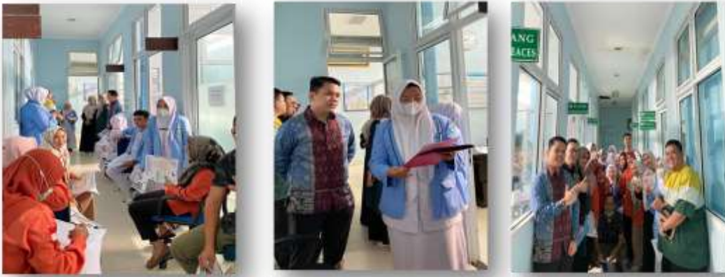
Gambar 4. Pembukaan Kegiatan oleh Ketua Tim dan Pembagian Poster Kepada Peserta dan penyampaian materi

penggunaan six sigma . Poster merupakan salah satu media yang terdiri dari lambang atau simbol yang sangat sederhana, poster juga merupakan salah satu media edukasi visual yang didesain secara menarik sehingga efektif digunakan dalam proses edukasi atau pembelajaran (Rahmah et al., 2020)