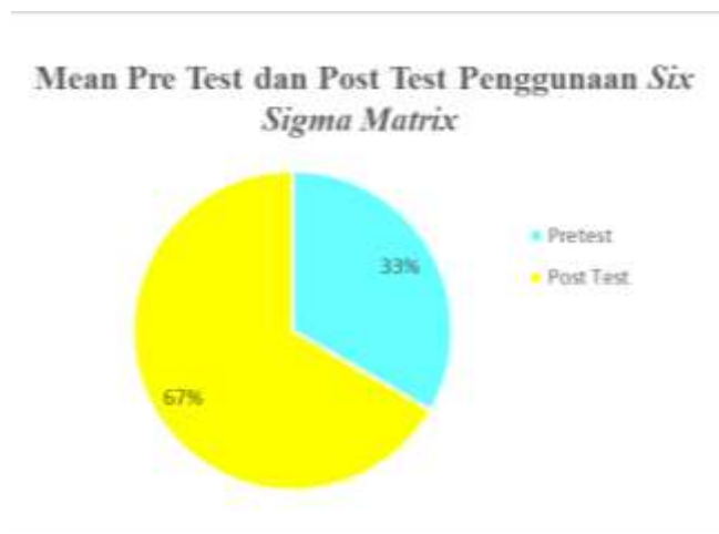
Gambar 3. Adanya peningkatan nilai posttest setelah dilakukan edukasi kepada peserta petugas Laboratorium RS Muhammadiyah Palembang dengan melihat nilai rata-rata 67%

Laboratorium adalah sarana kesehatan yang melakukan pengukuran, penetapan, dan pengujian terhadap sampel yang berasal dari manusia untuk penentuan jenis penyakit, penyebab, kondisi ataupun faktor yang menyebabkan adanya penyakit tersebut. Dalam rangka meningkatkan pelayanan laboratorium dan menjamin keselamatan pasien maka suatu laboratorium perlu menerapkan program pemantapan mutu yang cukup baik agar dapat memastikan hasil yang dapat diandalkan (Manik & Haposan, 2021) dan (Pratama et al., 2021). Menurut (Maji As, 2022) mutu laboratorium klinik dapat dikatakan baik apabila laboratorium tersebut memberikan pelayanan