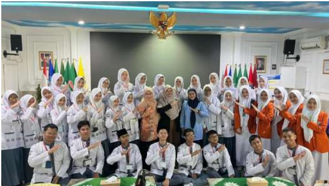
Gambar 1: Bersama Siswa/Siswi SMA 01 Palembang